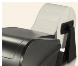
دارای پایه خروجی لیبل جهت تغذیه رولهای بزرگ و سنگین تا قطر ۲۵ سانتی متر