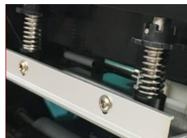
دارای هد توشیبا ساخت ژاپن