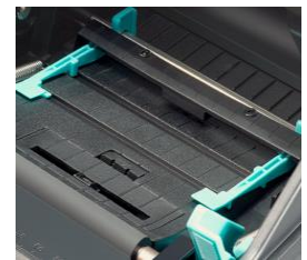
دارای سنسورهای Reflective, Transmissive و سنسور متحرک در پهنای لیبل